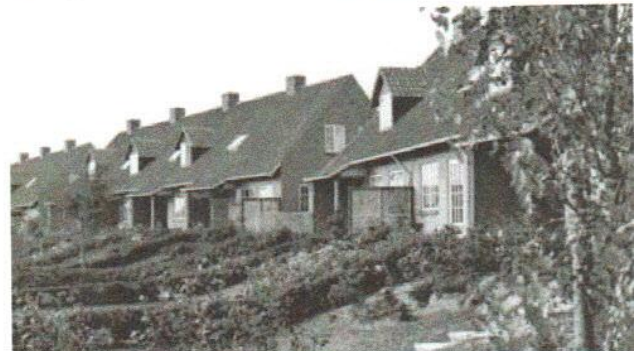
Kildebakkehusene. Foto Lokalhistorisk Arkiv, Gentofte. Fotoer af Jonals Co, 1949

Også om vinteren, når der lå højt med sne, mødtes vi og lod-sede til den runde. Og selv om de fleste af os spillede i omeg-